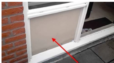
Paneel naast achter-/balkondeur

De panelen in de gevels vervangen we voor geïsoleerde gevelpanelen. Een gespecialiseerd bedrijf verwijdert de asbestpanelen zorgvuldig.